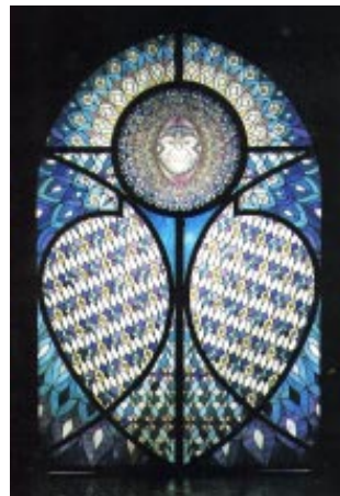
Die Pforte des Mondes

den A-Bürger, den B- und C-Bürger. Der C-Bürger entscheidet selbst wieviel und wie weit er sich einlassen will, lebt nicht unbedingt direkt in Damanhur, bezahlt nur die eigenen Kosten, ist aber ansonsten aktiv assoziiert und engagiert. Der B-Bürger lebt in Damanhur, hat aber noch eigene externe Interessen, die vorgehen.