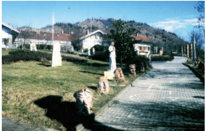
Eine Straße in Damanhur

ßen- und Schatzminister. Die Damanhurianer geben sich selbst einen Tiernamen oder einen Namen aus der Mythenvelt. Man sucht sich das Tier nach Sympathie und einem gewissem Bezug aus, der sich auch solchermaßen ausdrückt, daß man sich unter Umständen für diese Tierart engagiert. So trifft man hier also zum Beispiel den Gorilla, das Pferd (Cavallo), das Äffchen (Macaco), Kobra, Antilope oder Elf und Kobold.