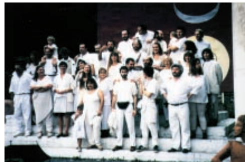
Die Schule des Orakels

verantwortlichen erlebt, die dauernd ans Telefon gerufen werden und eben für vieles zuständig sind. Es soll aber auch andere Zeiten gegeben haben, wo Geld sehr knapp und Arbeit mehr als reichlich vorhanden war, z.B. beim Bau des Tempels, wo teilweise rund um die Uhr in Schichten gearbeitet wurde.