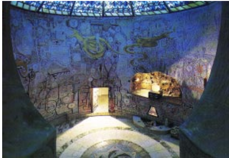
Der unterirdische Tempel des Lichts von Damanhur

Aber nun zurück zur sozialen Struktur. Je nach persönlichen Kommitment gibt es verschiedene Stufen der Zugehörigkeit: