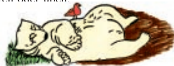
Die Bären-Meditation = chroooo, chrooo ...

Nein. Grundsätzlich gibt es den Meditationskurs, der einmal die Woche stattfindet, entsprechend dem Grad, und die jeweiligen Gruppen entscheiden, wann, wie oft und regelmäßig sie meditieren oder üben