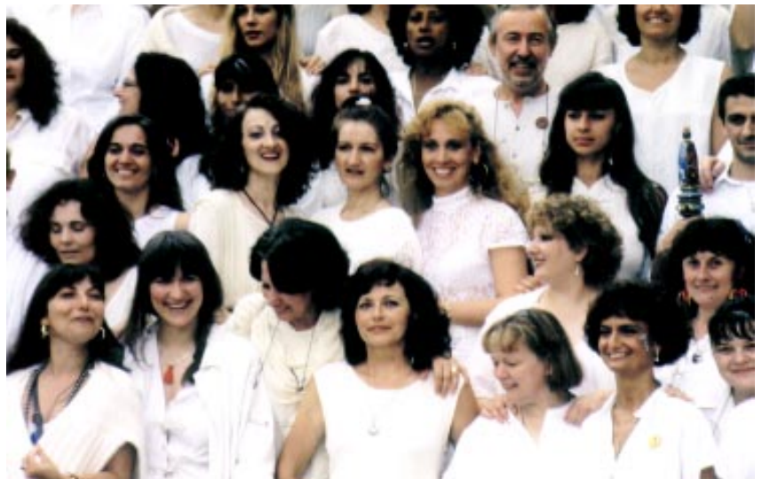
Die Schule des Orakels von Damanhur

Ein Justizkolleg gewährleistet die Beachtung der Verfassung