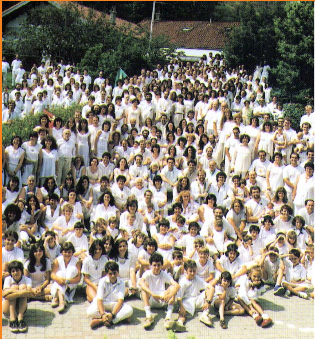
Comunità di Damanhur, I-10080 Baldissero C.se